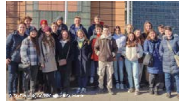
© Stefan Mak, BG/BRG Villach St. Martin